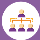
FIGURE E FUNZIONI ORGANIZZATIVE